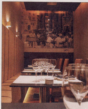
NONSOLOCAFFÉ. Una apuesta creativa y original por la tradición culinaria transalpina.

Nonsolocaffé, sin embargo, no es sólo un restaurante, sino un local polifacético que propone desde el auténtico desayuno italiano con cappuccino D.O.C. y pastelería recién horneada hasta meriendas con profiteroles, tartas artesanales y, como no, su exquisito tiramisú. Para los amantes del after-work , Nonsolocaffé presenta además un clásico de las tardes y las noches milanesas, el Aperitivo , cita ya obligatoria para muchos de los italianos que residen en Madrid. Todos los martes y miércoles de 19:00 a 23:00 h. se puede degustar una amplia serie de platos típicos del tapeo de Italia ( risotti , pizzette , focaccine , bruschette ...), pagando sólo las bebidas ( spritz , negroni , moji-